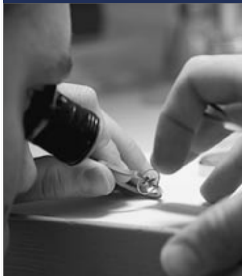
Donation Pen Preis ab CHF 790.-

Darauf zu sehen ein Auto, welches vor vier Jahren in der Schweiz zum Totalschaden erklärt worden war und heute in Khorog (Hauptort von Gorno Badakshan) im tadschikischen Pamir zu den aller-edelsten Fahrzeugen gehört.